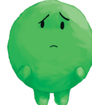
RASA TIDAK SELAMAT