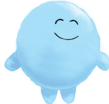
RASA MEMPUNYAI HARAPAN