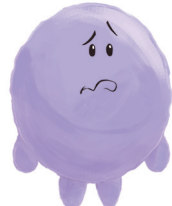
RASA MUDAH TERSINGGUNG