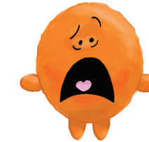
COM MEDO AMEDRONTADO