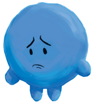
GAKKARI SURU がっかり する