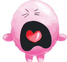
KIGEN GA WARUI きげん が わるい