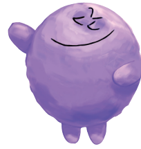
YUUKI GA ARU ゆうき が ある