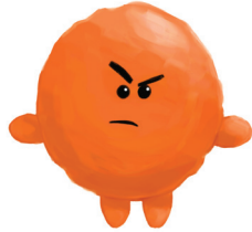
IRAIRA SURU いらいら する