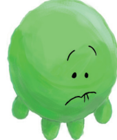
KOKOCHI YOKUNAI ここちよくない