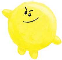
KOUKISIN GA ARU こうきしん が ある